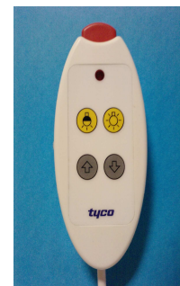
Manipulateur série Mix.SD15