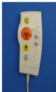
Manipulateur étanche série 125.59xx